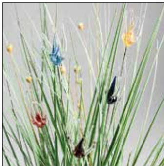
5 GLASMANUFAKTUR BORGARDT