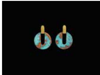
31 JACQUE PODSIGUN