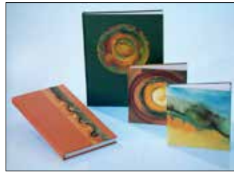
21 ATELIER BUCH & TUCH