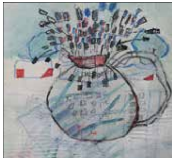
6 ATELIER 208 Ib Plate