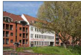
34 KÜNSTLERHAUS BREMEN