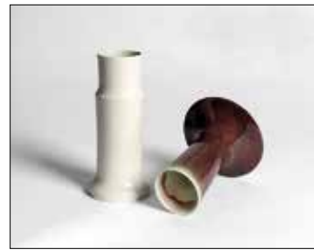
16 BERND FISCHER