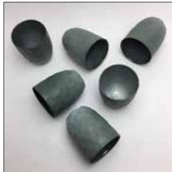
29 LUISA COSTA