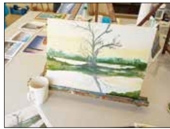
18 DORIT HILLEBRECHT