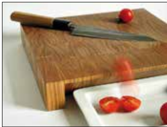
2 HUBERT STEFFE