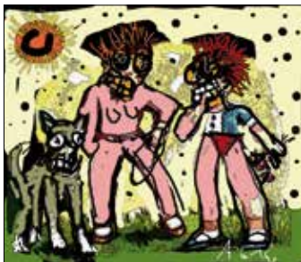
1 ALFRED GRONAK