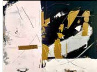
12 KATHRIN LÖTZ