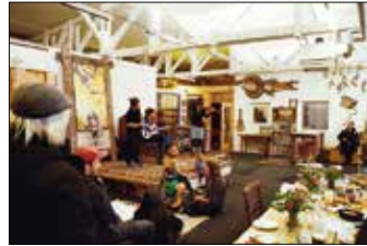
22 ATELIERGEMEINSCHAFT DIE ZENTRALE