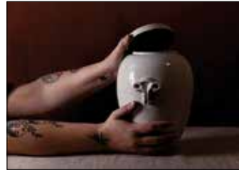
10 LAURA SOLAR