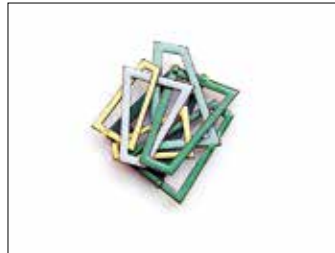
25 DANNI SCHWAAG