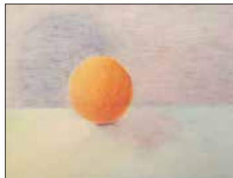
28 KUNST[ ]RAUM BREMEN