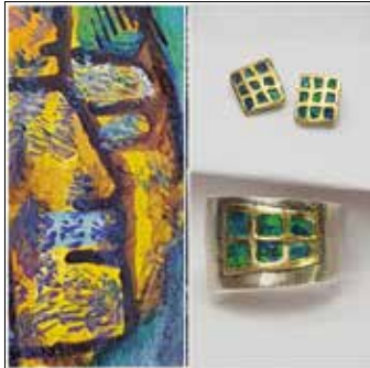
3 ANJA KONTNY