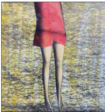
4 EVA KARSTENDIEK