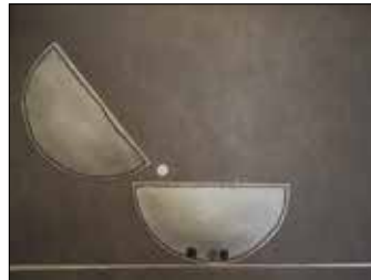
27 ULRIKE BRINKHOFF