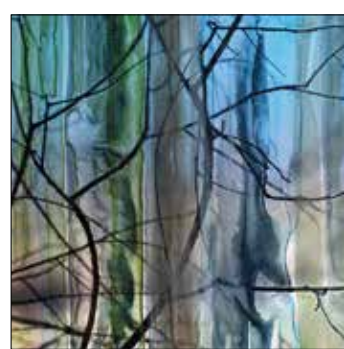
15 RENATE SCHÜTZ