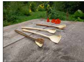
14 UTE IHLENFELDT